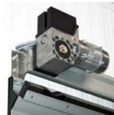
Motor de automatismo