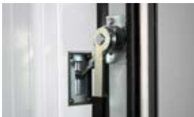
Detalle de cierre maneta excéntrica