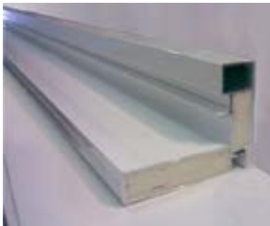
Sección marco inyectado