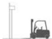
■ campo magnético