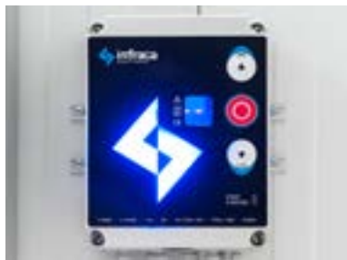
Cuadro de control IF10VF