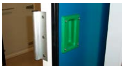
Maneta interior y exterior