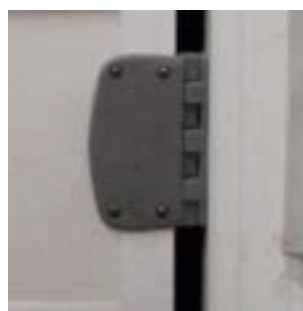
Bisagra de poliamida con retorno 90°