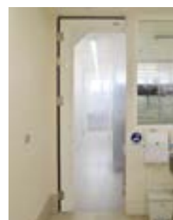
Batiente flexible PVC