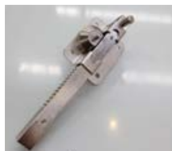
Cerradura inox de puerta batiente