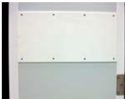
Defensa de serie

Marco ..... ■ Sistema de marco y contramarco para adaptar a cualquier espesor, posibilidad de adaptar el marco a obra civil o a panel de aluminio.