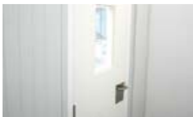
Detalle de herrajes