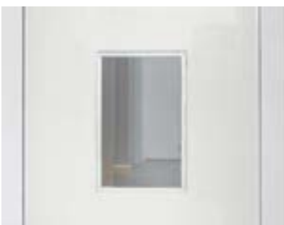
Mirilla de cristal