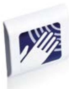
Pulsador sin contacto