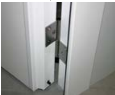
Burlate guillotina integrado en la hoja