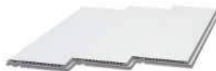
Placa alveolar techo